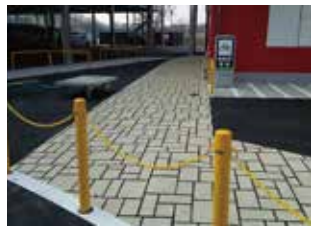
ショッピングセンター構内