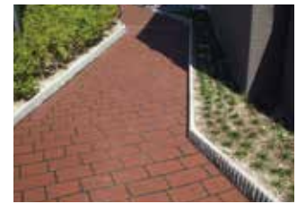
ベビーカーが通る遊歩道