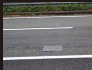
高速道路での適用例

PMR99+は、強さと柔軟性を兼ね備えた超高粘度アスファルトマット型舗装補修材です。損傷の初期段階（小面積のひび割れなど）で路面に貼り付け補修を行います。舗装の延命化を図り、ライフサイクルコストを低減させ、予防保全的維持に最適な材料です。