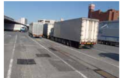
埼玉県内 物流センター