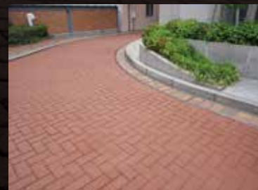
広島県内 商業ビル外構

ABCD舗装は、敷均し後または既設のアスファルト舗装の上にテンプレートを設置し、この上から転圧することにより、表面にブロック状のパターン模様をつけます。通常のアスファルト舗装に比べて、デザイン性に優れた舗装となります。