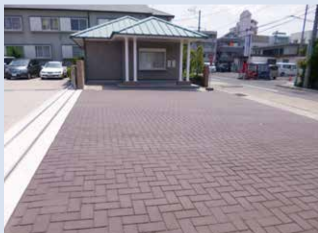
鹿児島県内 学校エントランス