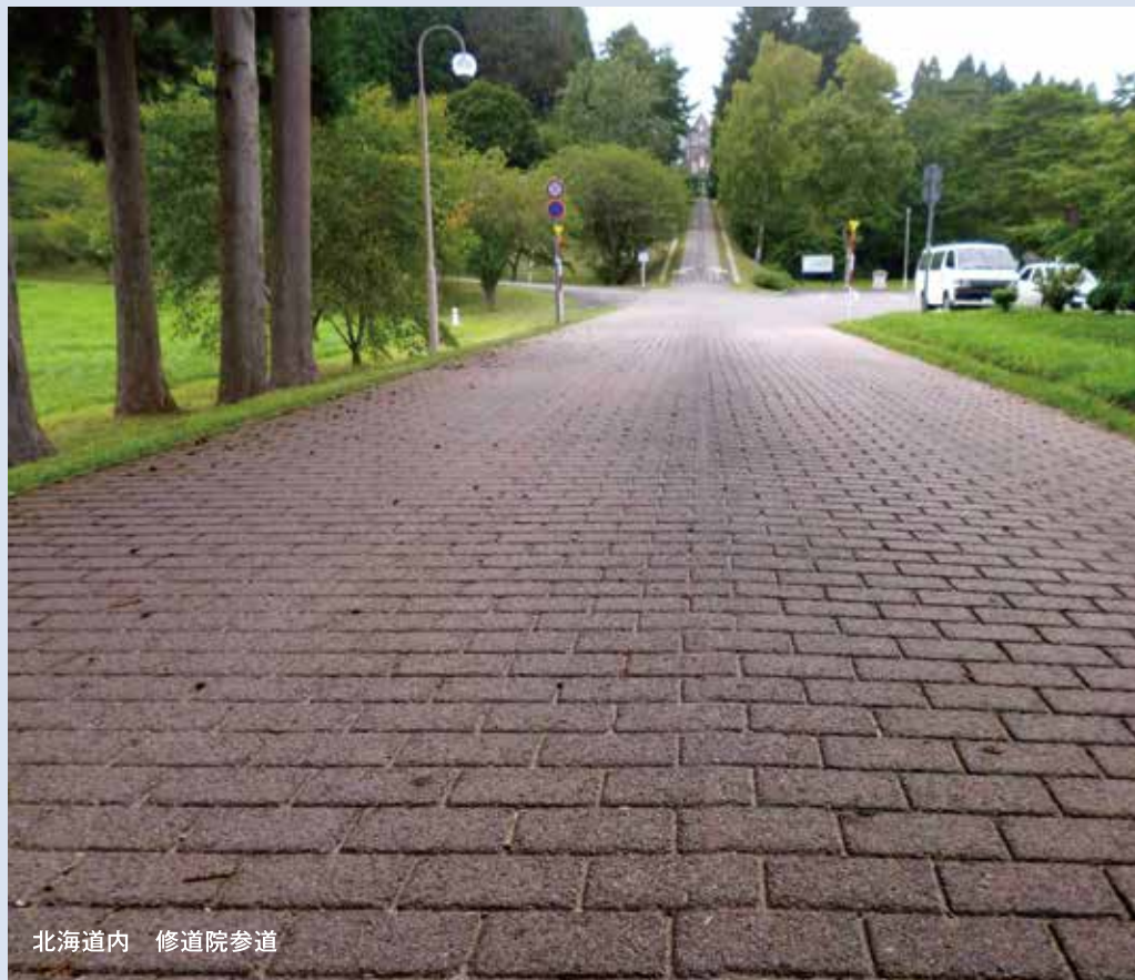
北海道内 修道院参道

※ABCDとは、Asphalt Block Compacted Designの略です