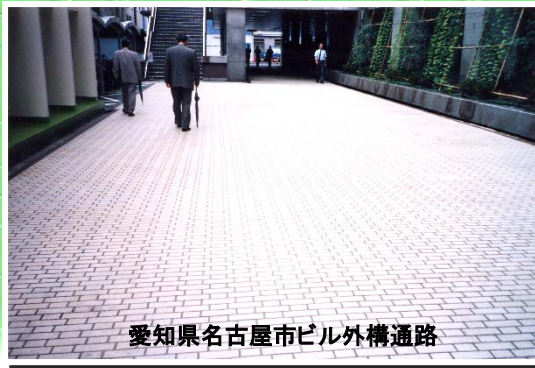
愛知県名古屋ビル外構通路