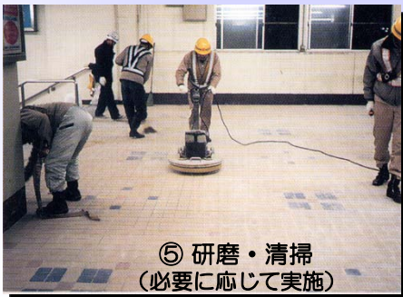
⑤ 研磨・清掃 (必要に応じて実施)