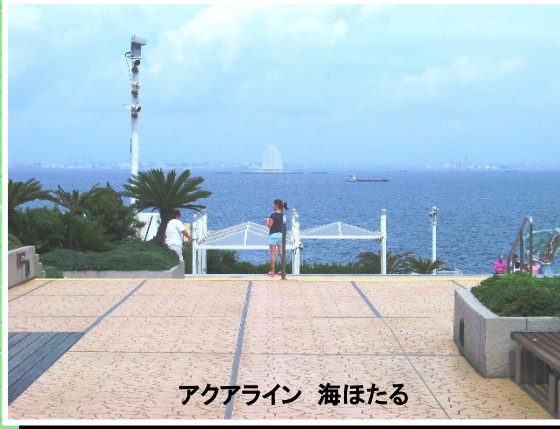
アクアライン 海ほたる