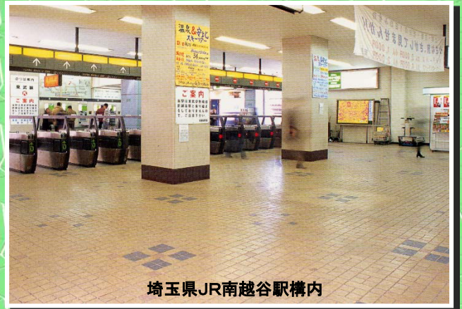
埼玉県JR南越谷駅構内