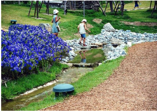
福島県うつくしま未来博