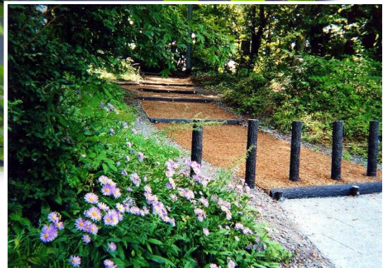
長野県松原湖畔遊歩道