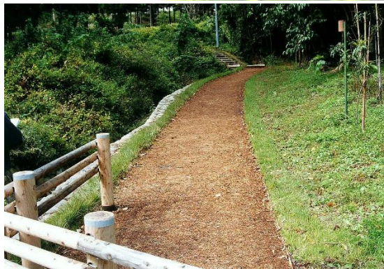
岩手県中尊寺散策路