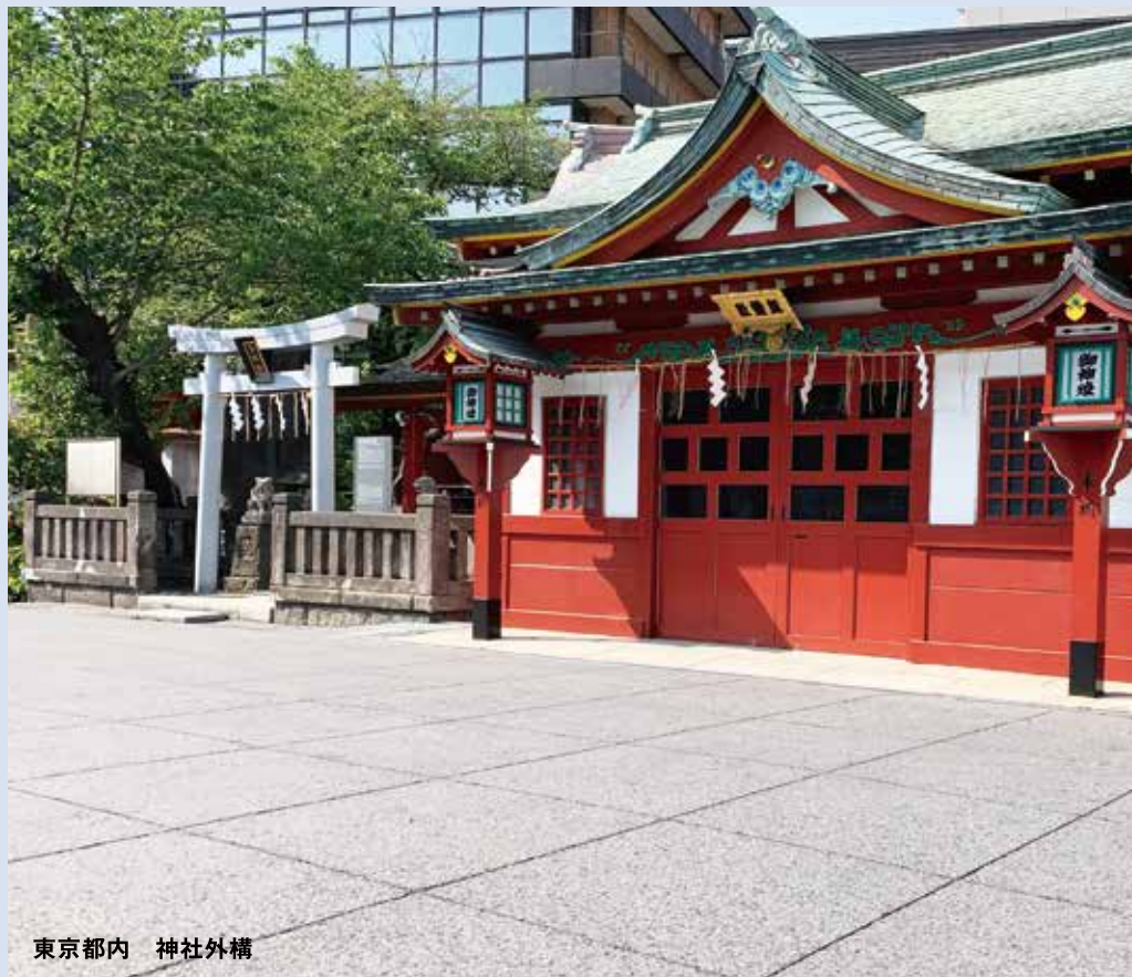
東京都内 神社外構