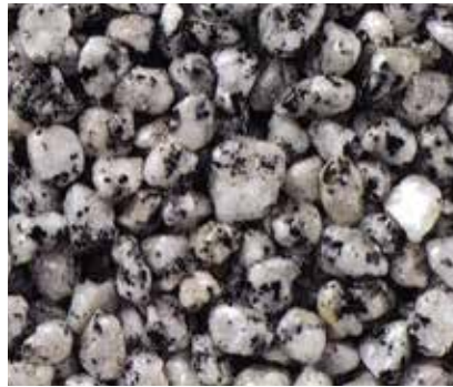
シンアワジ 新淡路