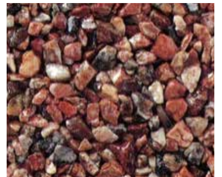
ベニサンゴ 紅珊瑚