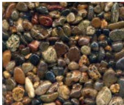
カシマキンカ 鹿島金華