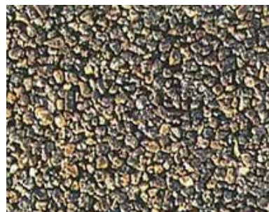
透水タイプの表面